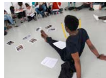
Crédits : Hélène Agofroy, Playground , École supérieure des beaux-arts TALM-Tours, 2017.

Présence, recherche, participation et réalisation.