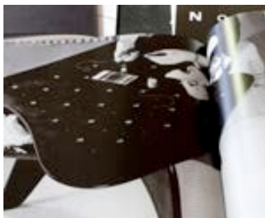
Crédits : Isamu Noguchi, Chess Table shown as a sewing table , Vue de monographie, J.A. Benítez, 2017

Investissement et qualité de présence. Progression des pistes de recherche. Qualité plastique des propositions