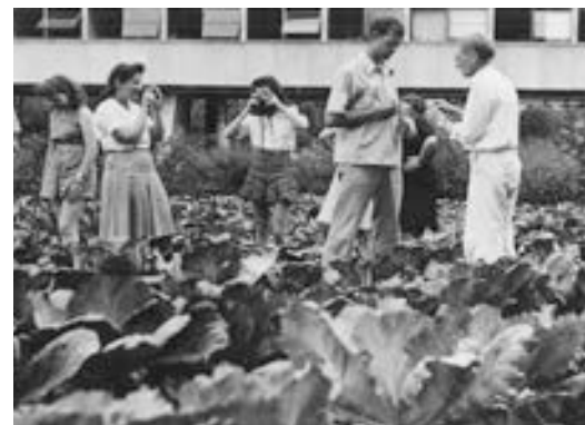
Crédits : Black Mountain College, Fotografieunterricht mit Josef Albers, Lake Eden Campus, um 1944 © Courtesy of Western Regional Archives, States Archives of North Carolina