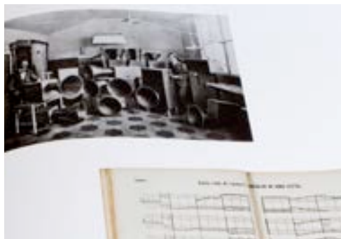
Crédits : Luigi Russolo, Noise machines , Vue de monographie, J.A. Benítez, 2017.